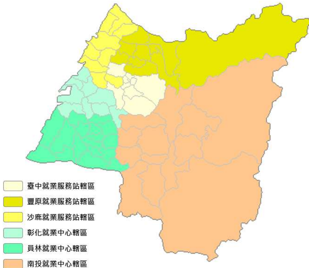
圖 1 本分署轄區示意圖

本分署編製報表之資料來源,係來自「勞動部勞動力發展署就業服務資訊整合系統」,即公立就業服務機構受理求職、求才之業務數據,雖未能完全涵蓋勞動市場活動全貌,但仍可藉此初步掌握轄區人力供需變化之脈動,提供各界參考運用。