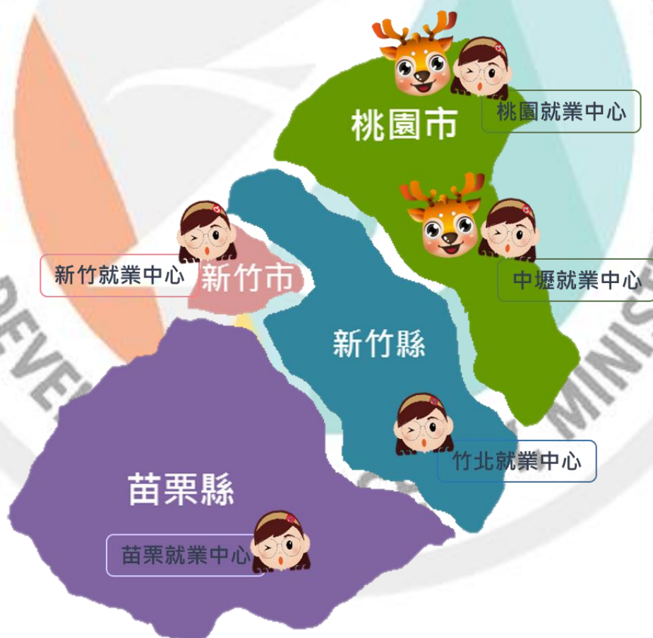
圖 1 桃竹苗轄區圖

本季報資料置於桃竹苗分署網站之「訊息中心-政府資訊公開-業務統計」網頁內，倘若不盡周全，敬請指教（ http://thmr.wda.gov.tw/ ）。