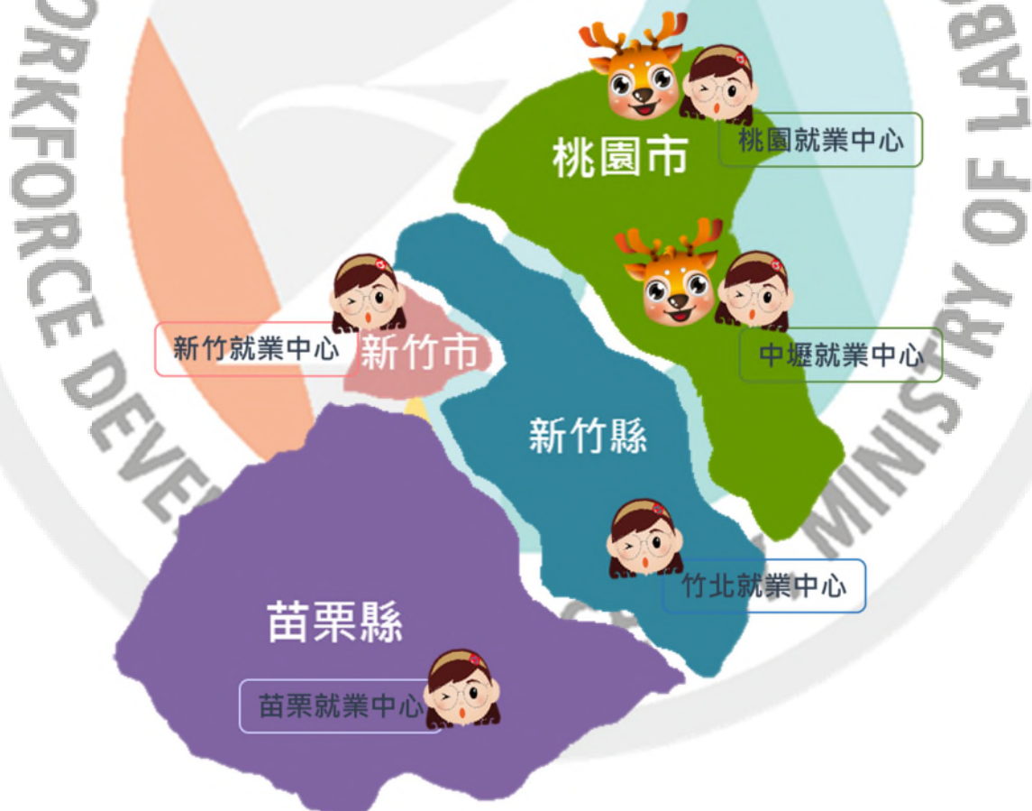
圖 1 桃竹苗轄區圖

本季報資料置於桃竹苗分署網站之「訊息中心-政府資訊公開-業務統計」網頁內，倘若不盡周全，敬請指教 ( http://thmr.wda.gov.tw/ )。