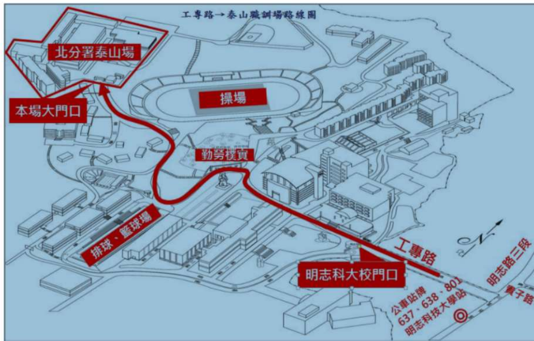
泰山職業訓練場交通地圖

泰山職業訓練場交通位置描述：位於明志科技大學校內，由工專路進入明志校內，沿明一路/泰山職訓中心路標而上，約800公尺。