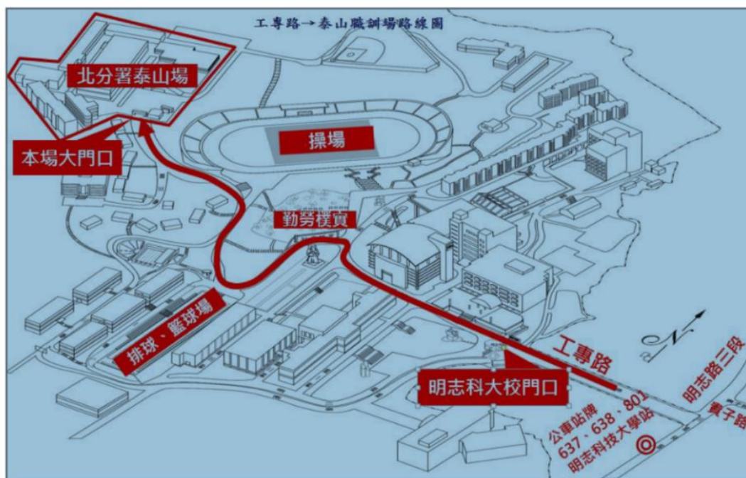
泰山職業訓練場交通地圖

泰山職業訓練場交通位置描述：位於明志科技大學校內，由工專路進入明志校內，沿明一路/泰山職訓中心路標而上，約800公尺。