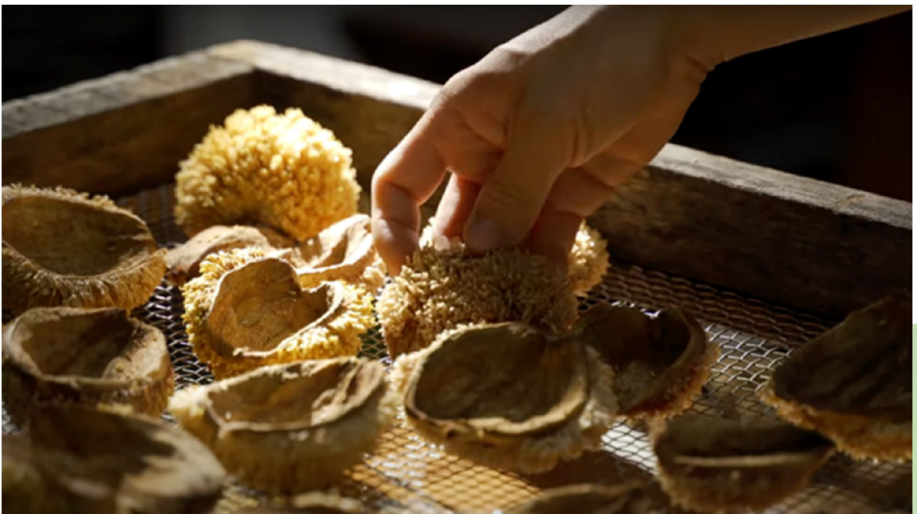
自然風乾的愛玉籽

提到臺灣經典消暑甜點，愛玉無疑是最具代表性的美味之一。但你知道嗎？愛玉的生長環境、採收方式，甚至是市場上的真假問題，都與這項傳統美食的未來息息相關。在高雄市桃源區的復興部落，一群熱血小農正在努力，採用友善農法種植純正的臺灣原生愛玉，讓美味能夠世代傳承。