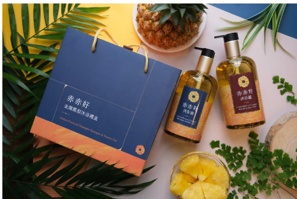
金鑽鳳梨沐浴禮盒