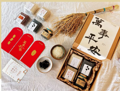
採用社區的有機米，設計新年禮盒「蛇米龍舞」