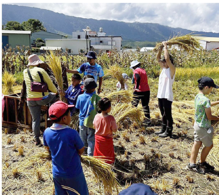
舉辦食農教育，孩子們體驗割稻、脫穀等步驟，從中學習珍惜食物

池上鄉萬安村，一場關於友善農業與地方創生的革新正悄然展開。協會加入勞動部高屏澎東分署的培力計畫，藉由計畫資源挹注，讓「稻米原鄉館」成為社區對外的交流窗口，同時整併「自遊池上」品牌，升級旅宿機制，穩定營運，落實地產地銷，並在此基礎上建立自給自足支持系統。不僅為農業轉型策略，更是融合當地農村文化與經濟發展的永續模式。