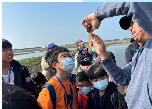
小學生近距離認識養殖魚蝦

為讓彌陀漁村永續發展，團隊積極推廣食魚教育，藉由益生菌創造無毒養殖環境的「無垢養殖」，生產無毒魚產品。透過基地導覽解說、產地餐桌體驗、與學校合作課程等，推動地產地銷。從魚塭捕撈、加工到烹調，一步步探索產地到餐桌的過程，讓更多人認識在地漁業價值，因著消費端的參與，帶動產業轉型。此外，團隊亦提供專業培訓、實習機會和創業支持，培育青年漁民人才。