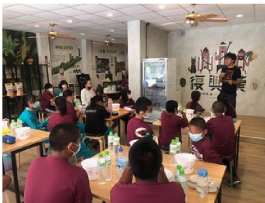
手洗愛玉體驗教學