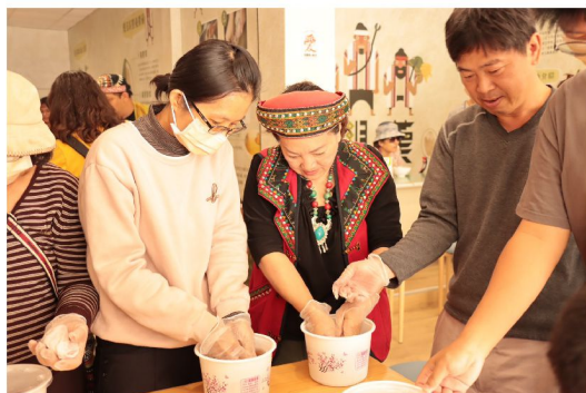
雙手輕揉愛玉籽，讓天然膠質慢慢釋放至清水中

愛玉的種植不同於一般農作，主要依賴「愛玉小蜂」授粉，因此須在無毒環境自然生長。保證責任高雄市原鄉愛玉生產合作社深知這份生態的微妙平衡，積極推動友善農業，合作的農友也持續往有機轉型及無毒栽培邁進。另外，合作社也藉由多元就業開發方案資源挹注，將自然資源、原民文化、在地農產進行整合，發展專屬復興部落的觀光產業，藉由教育與培訓，帶動當地居民加入促進在地產業發展的行列。