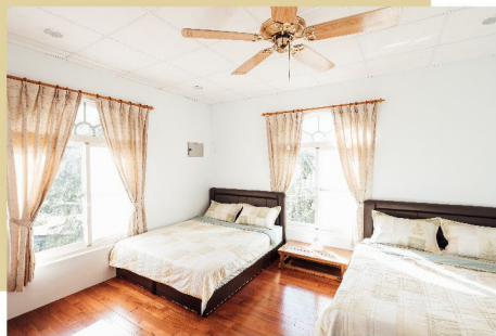
推出連泊駐村方案，以彈性的駐村選擇吸引年輕人走進池上。