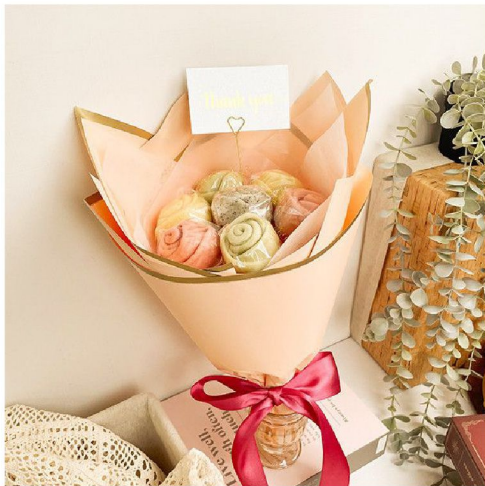
玫瑰花造型饅頭花束