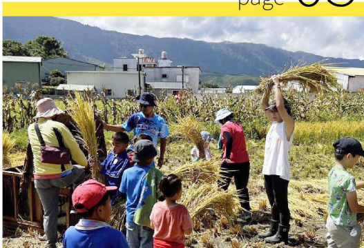
臺東縣池上鄉萬安社區發展協會 稻米原鄉館