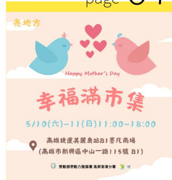
市集活動宣傳 快訊