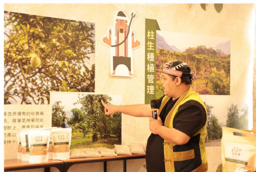
介紹愛玉的種植與管理方式

除了種植，合作社進一步推動「復興漢-愛玉故事館」，讓消費者親自走進愛玉區，體驗手洗愛玉樂趣，了解愛玉的生長環境與生態價值，不僅是一場味覺饗宴，更是一場認識土地的旅程。藉由導覽與食農教育，希望讓更多人支持臺灣本土農產。