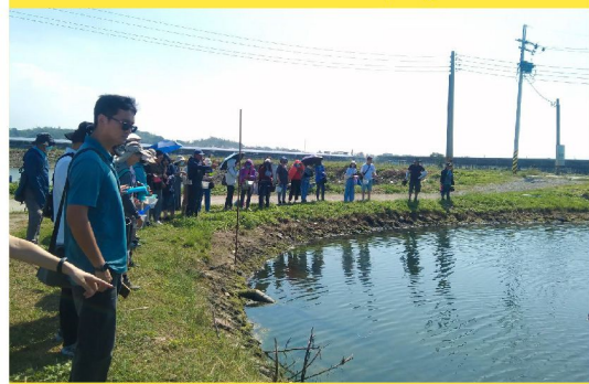
高雄市青創客地方創業發展協會 魚博士鮮時批