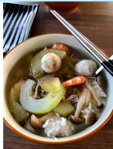
產地到餐桌—在地食材飯湯