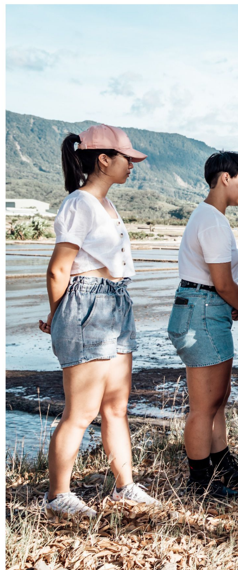
由地方農夫擔任導覽員，帶領人們實境體驗

自1995年以來，協會持續積極輔導小農進行友善耕作，累積深厚的有機農業經驗，因此，「稻米原鄉館」，不僅是展示地方文化的空間，更是實踐友善農業的場所。在這裡，人們可以購買到來自萬安村小農的優質農產品，還能藉由農夫大哥深入淺出的實地導覽，以及精采有趣的食農教育活動，親身體驗稻田文化，進而認同友善農耕價值。