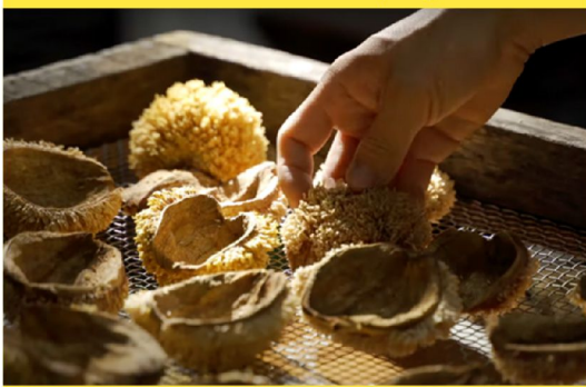
保證責任高雄市原鄉愛玉生產合作社 愛玉知多少