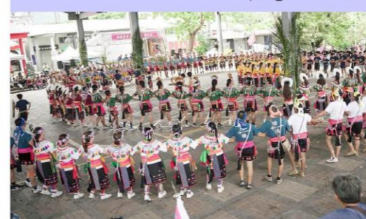
社團法人臺東縣東河鄉阿度蘭阿美斯文化協進會 都蘭之國。文化復振