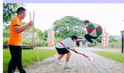
高雄市內門區三平社區發展協會 鼓聲再起。傳承不息