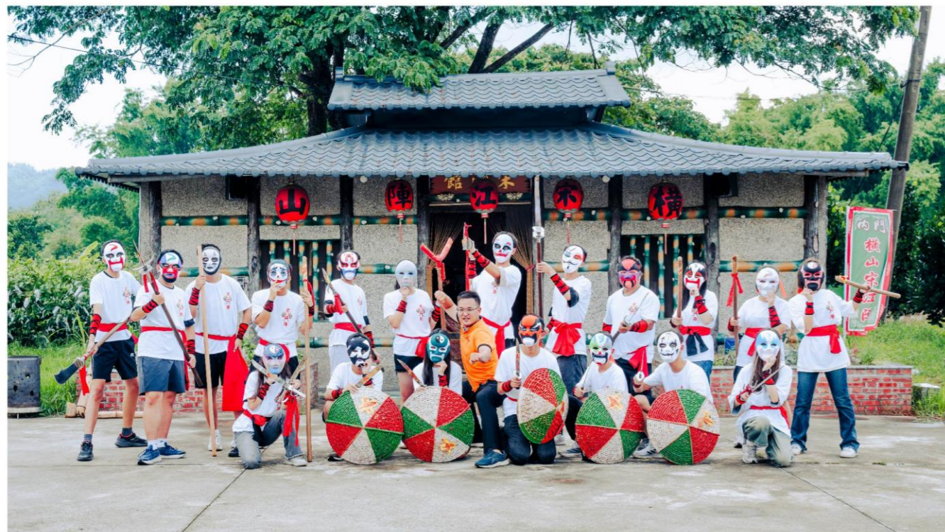
宋江陣、臉譜彩繪一日體驗

內門，座落在高雄東北的一方山城，是一塊讓文化靜靜醞釀的土地，走進這裡，彷彿走進時間的褶皺裡。鼓聲未響，山風先至，從山腳到廟埕，歷史與傳說在空氣中緩緩流轉。宋江陣是內門人的集體記憶，動員所有居民不分年齡，當鑼鼓響起，人們穿上武服、手執兵器，隨著節奏踏出代代傳承的步伐，不單為表演，亦是保衛家園與勇氣展現的決心。