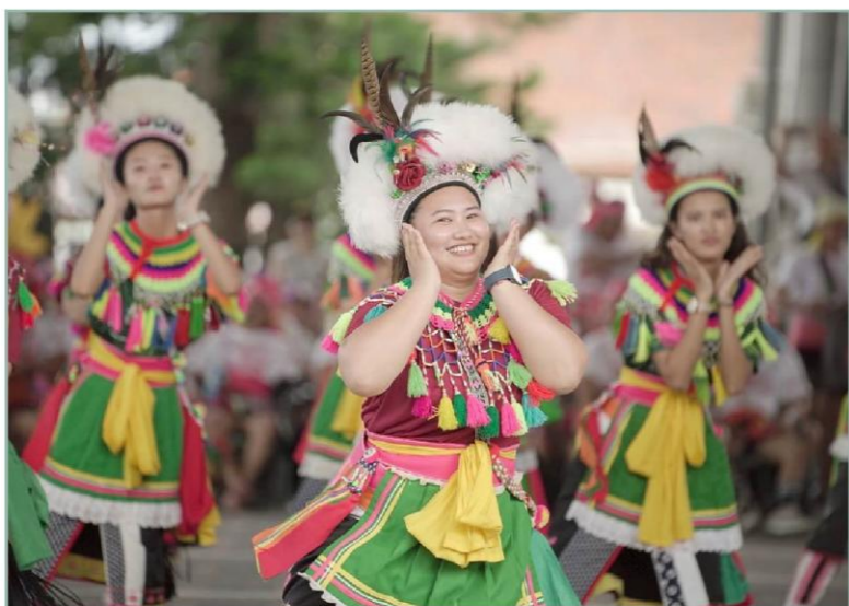
都蘭部落豐年祭大會載歌載舞

阿度蘭阿美斯文化協進會，以都蘭部落的「文化及生態永續」為目標，持續挖掘與梳理部落歷史與文化，包含食農文化，例如海洋漁獵、野菜採集等；運用部落族群知識與記憶，舉辦豐年祭、復辦獵祭，期待成為原住民自治示範的文化重鎮。並藉由勞動部支持，以地域集結在地夥伴，創立「都蘭國」品牌，成為旅人認識都蘭的第一站，不僅販售精緻的部落工藝品，也介紹部落傳統與祭儀文化故事，搭配官網社群策略，使用影像紀錄都蘭的歲時祭儀，打開品牌知名度並深化影響力。