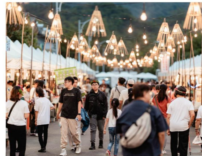
配合大武壠歌舞文化節，融入傳統捕獵漁具——魚笥的「日光魚笥市集」

閒置空間在協會努力下煥然一新成為「大武壠產銷館」，館內陳列土地的饋贈——薑黃粉、雞角刺茶包、薑黃香腸等在地商品，也能品嚐薑黃雞腿飯、薑黃臭豆腐等特色風味。二樓將陸續規劃歷史展示與文化成果，讓遊客理解重建歷程與族群智慧延續。2025年，這份努力獲建築園冶獎「社區景觀營造類」肯定，也成為地方凝聚力與文化自信的象徵。