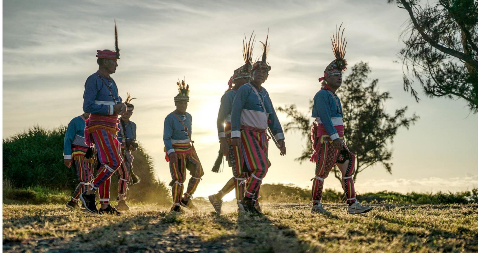
豐年祭前所舉辦的Mita'ong to liteng-祭告祖靈

此外，協進會與部落長者、青年攜手復振文化，讓阿美族特有的「年齡階層」文化（註1）與「Pakarongay 青少年訓練」（註2），再次成為生活核心。從採竹、剝竹、削竹、生火，到Limocedan小姐組（註3）的編織、毛球製作與舞蹈，每一個動作都承載著時間的重量與族群的智慧。這些技能如今也化為不同層次的文化體驗行程，從一日的基礎認識，到三、四日的深度實作，節奏緩慢而充實，讓旅人以雙手與身心貼近部落生活。