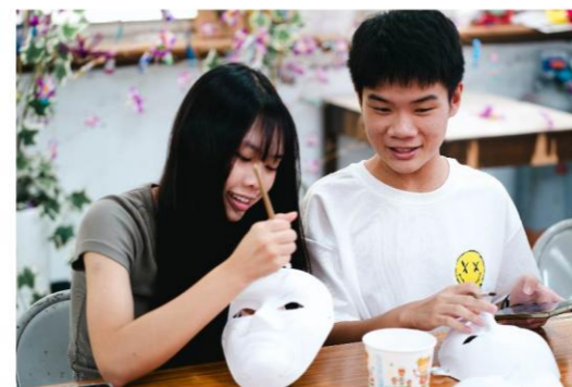
親手彩繪屬於自己的臉譜彩繪

每年三月是宋江陣嘉年華，內門會湧入超過十萬名觀光客，卻未能成為地方主要的觀光文化財。為讓宋江陣成為社區常態性的觀光遊程，三平社區發展協會挺身而出，經由勞動部的輔導，將宋江陣式「蜈蚣陣」、「生死對」、「八卦陣」等招式融入體驗活動中，包含雙人對打、簡易陣式變換、武術演練等，經由專業人員指導，大家都能化身為一日宋江陣子弟，模擬古時抵抗外敵打鬥的緊張氣氛，同心守護家鄉的團結精神。協會也將出陣特有的臉譜彩繪融入DIY活動，臉譜色彩與線條參考水滸傳元素，人們藉由不同的顏色和圖案，認識水滸傳的角色和代表性格，也因著親身體驗，對宋江陣歷史有更深刻的認識與感受。