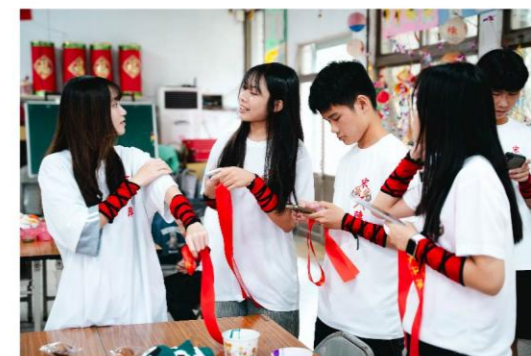
著裝準備體驗宋江陣

在內門，總舖師不只是廚師，更是承載地方記憶的文化守護者。昔日婚喪喜慶的辦桌盛況，如今化作三平社區的旅遊體驗亮點。遊客可在師傅指導下，親手製作象徵豐盛與圓滿的八寶丸，從揉捏、包餡、油炸，於香氣氤氳間，聽師傅說起早年節儉惜物的故事；或端上一碗熱騰騰的羅漢餐，品嚐廟埕聚餐的濃厚人情。結合在地導覽與互動遊戲「奔跑吧，八寶丸」，讓旅人用味蕾與雙手，走進內門的生活與歲月。