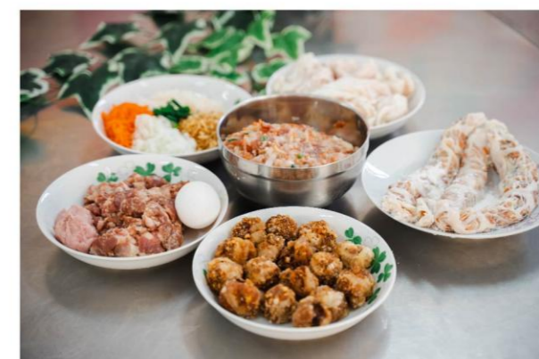
製作八寶丸所需材料

腳步放慢，走進內門，在鼓聲、鍋鏟聲與手作體驗裡，與文化不期而遇。也許一張臉譜、一顆八寶丸，或是一把的兵器，讓人們悄悄與這片土地，繫起最初的情感連結。