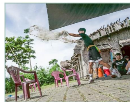
Kiloma'an青少年訓練營：撒網

此外，協進會與部落長者、青年攜手復振文化，讓阿美族特有的「年齡階層」文化（註1）與「Pakarongay 青少年訓練」（註2），再次成為生活核心。從採竹、剝竹、削竹、生火，到Limocedan小姐組（註3）的編織、毛球製作與舞蹈，每一個動作都承載著時間的重量與族群的智慧。這些技能如今也化為不同層次的文化體驗行程，從一日的基礎認識，到三、四日的深度實作，節奏緩慢而充實，讓旅人以雙手與身心貼近部落生活。