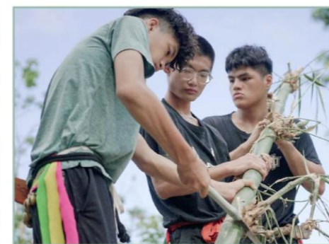
Kiloma'an青少年訓練營：砍竹編織