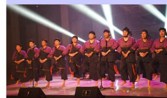
高雄市杉林區日光小林社區發展協會 山河新生。日光照耀