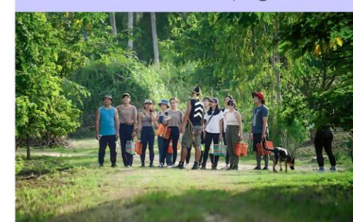
遊程、產品資訊快報 快訊