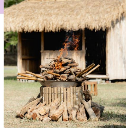
公廨與象徵生命的火

在勞動部資源挹注下，日光小林社區發展協會留住返鄉青年，藉由田野調查，重新找回大武壠文化，將社區打造為全國第一、也是唯一的大武壠文化園區。走進社區，能欣賞古調悠揚的大滿舞團演出，感受歌聲裡代代傳承的土地情感。同時，也能在實境遊戲裡化身獵人，在魚笥與線索之間體驗社區魅力；或親手編織藤環，感受指尖上的藤條韌性；製作魚笥，體會守護溪流與生計的智慧結晶；拿起針線，在十字繡方格裡繡下花紋符號，每一針每一線都是對傳統的尊重，也是生活美學的延伸。