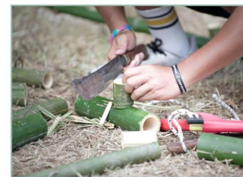
將竹子砍成需要的大小

在都蘭，文化不是冰冷的展覽，而是流動在風裡、樹間，與生活緊密相連的呼吸。這片土地的每一個細節，都訴說著族人與自然的共生與傳承。走過這裡，除了明媚的风景，還有悠遠的人文歷史，邀請人們感受那份跨越時代，延續至今的生命力。