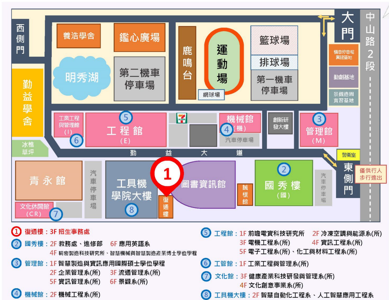
圖 2 校園位置圖